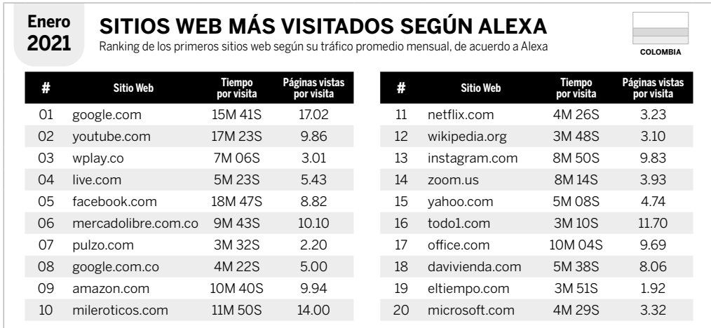
Sitios web más visitados según Alexa.