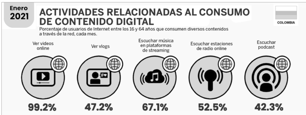
Actividades relacionadas al consumo de contenido digital.