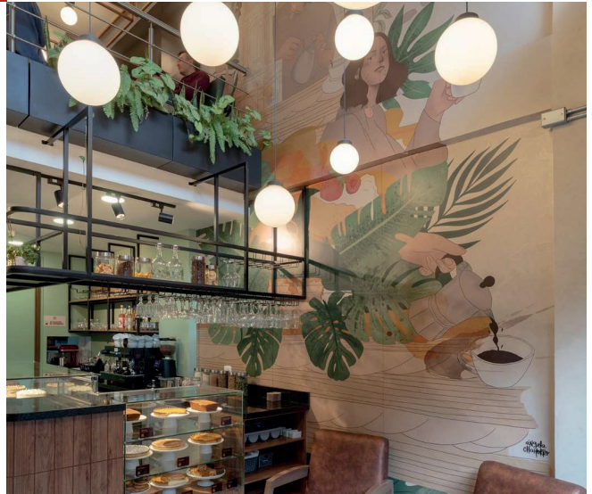
Retail - Mil hoja repostería (2023) Pasto, centro Área 100 m2