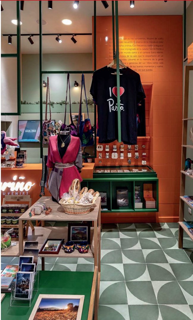
Retail - Nariño Souvenirs (2022) Pasto, centro Área 35 m2