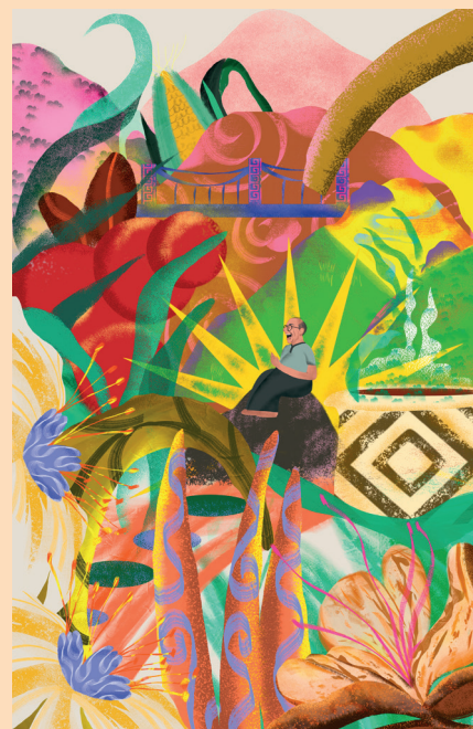
Ilustraciones cortesía de Claudia Jaramillo

Diagramado por Karol Chaves Estudiante de Diseño Gráfico Universidad de Nariño