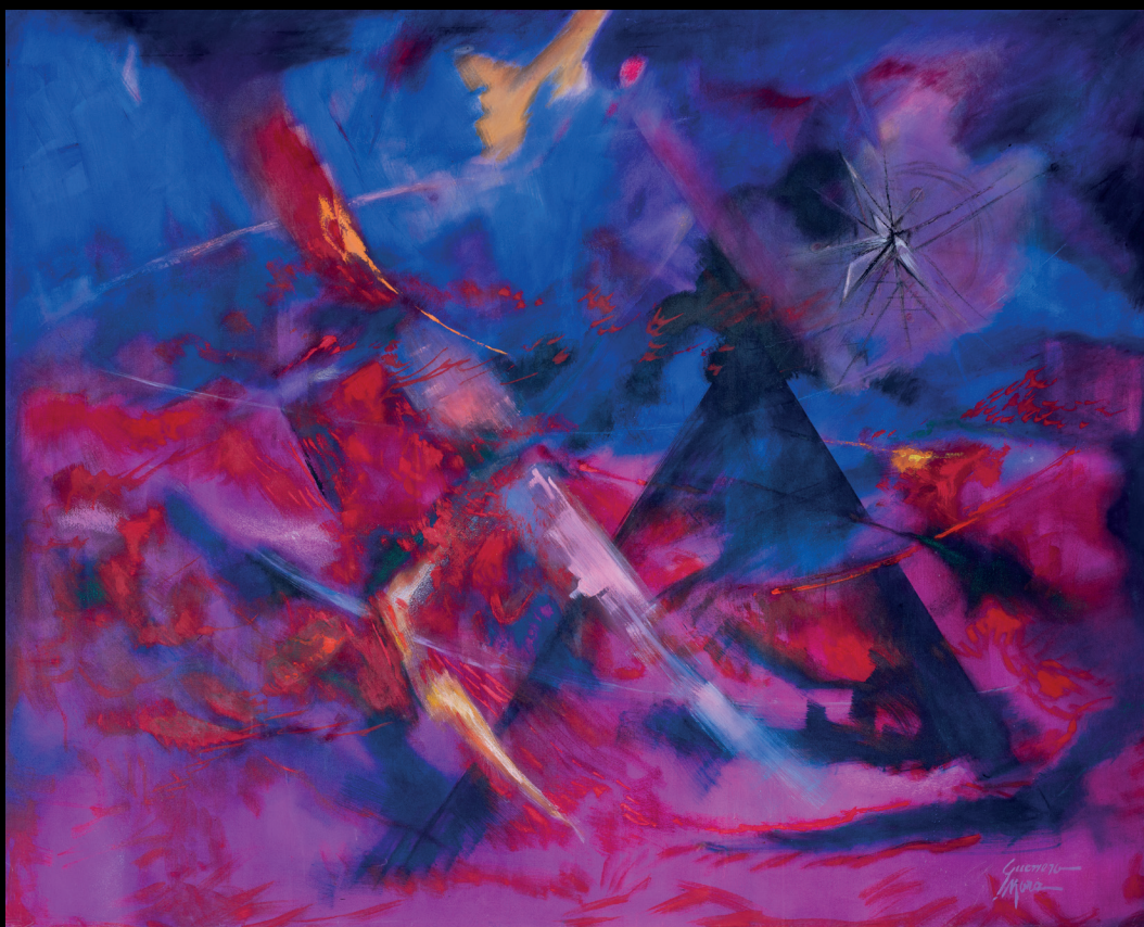
Manuel Guerrero Mora Serie Sur/Otros Caminos 200 x 160cm Óleo sobre lienzo 2025

Este universo visual no surge de manera espontánea. La obra de Guerrero Mora responde a una profunda conciencia del oficio pictórico. Cada mancha, cada trazo y cada capa de óleo forman parte de una construcción rigurosa del espacio visual. En su pintura, el gesto expresionista no se manifiesta como un impulso arbitrario, sino como una exploración controlada de la materia y la emoción. La mancha no es accidente, sino el resultado de una búsqueda persistente de equilibrio, tensión y profundidad dentro del lienzo.