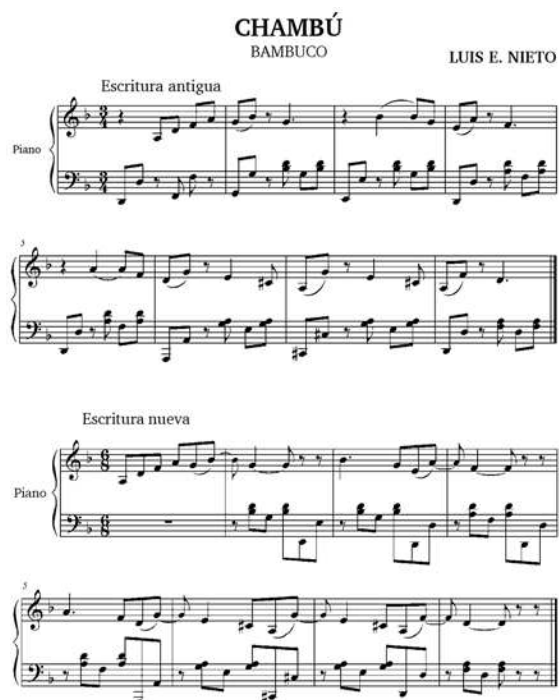
Ejemplo No. 1

anacrúsico generalmente representado por una negra o su correspondiente subdivisión en corcheas. En los medios académicos se ha optado por escribirlo exclusivamente en 6/8 para enderezar los acentos de la melodía y facilitar su lectura. Conviene decir que para el intérprete popular, quien toca el bambuco de manera intuitiva, esta circunstancia es completamente irrelevante. Los primeros transcritores de bambucos, en un enfoque prejuicioso, quisieron darle a las sencillas tonadas populares las características del vals o del pasillo que se escriben en 3/4, en un proceso que intentó estilizarlo para borrar su procedencia negroide, ya que la mayoría de la música negra es binaria. Esta equivocación, la escritura en compás ternario, le ha dado al bambuco la categoría de difícil siendo este un ritmo elemental que, escrito de la manera correcta, es accesible para los músicos de cualquier latitud.