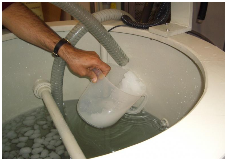
Figura 1. Hielo líquido sistema por inmersión de la materia prima