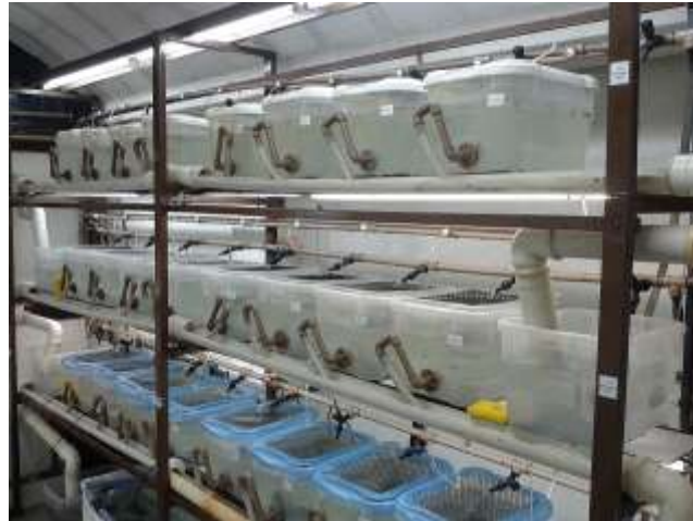
Figura 1. Vista del laboratorio donde se ejecutaron los ensayos

Para controlar el nivel del agua en los acuarios y para facilitar la remoción del líquido del fondo con los sólidos sedimentados, se dispuso en una de las caras laterales, a 5 centímetros de la base, un orificio lateral de ½” conectado a segmentos de tubo que formaban una “u” invertida; el líquido que salía de cada unidad era colectado en una canaleta de PVC de 50 mm de diámetro, que llevaba el agua hacia el acuario que hizo las veces de sedimentador, donde una bomba marca Robertshaw, modelo BAV1100-01UC enviaba el efluente por tubería de ½” de regreso hacia una red de distribución a los acuarios. En la Figura 1 se presenta una imagen con seis de los sistemas de recirculación utilizados en el experimento.