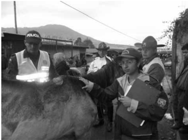
Figura 1. Operativos de control y seguimiento de animales de trabajo por parte de entes gubernamentales e involucrados en el Bienestar Animal.