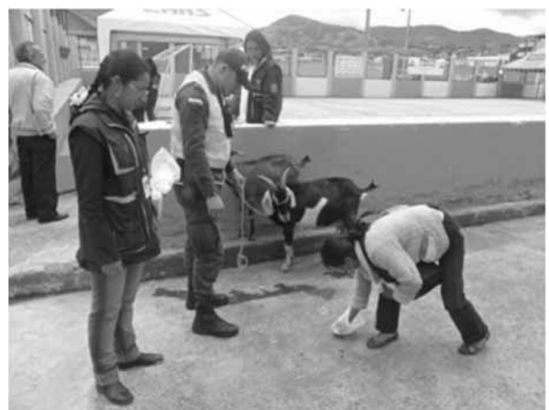
Figura 6. Sensibilización a la comunidad en general sobre Bienestar Animal y corresponsabilidad ambiental.