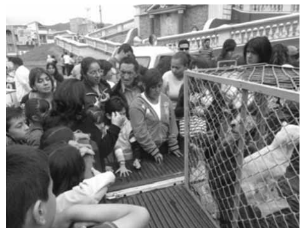
Figura 5. Campañas de adopción canina.