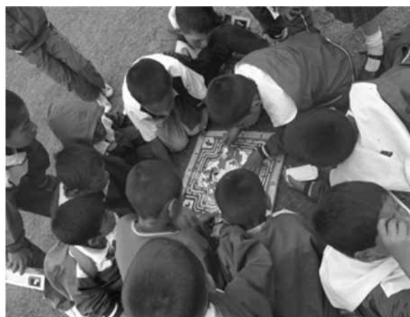
Figura 3. Aplicación de metodologías pedagógicas para la promoción del Bienestar Animal.