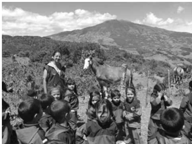
Figura 2. Jornadas pedagógicas a jardines, escuelas y colegios sobre Bienestar Animal y Corresponsabilidad Ambiental.