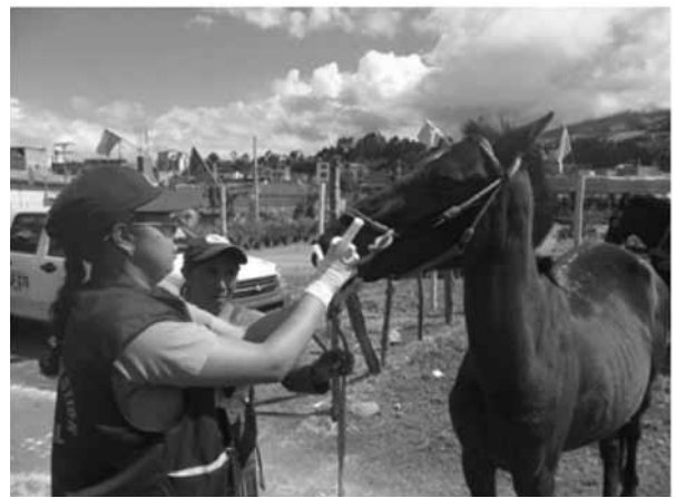
Figura 4. Jornadas y brigadas de bienestar animal y medicina preventiva en animales de trabajo. Jornada de desparasitación y suplementación equina.