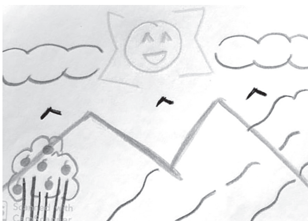
Figura 2. Representación de lo rural por elementos naturales convencionales

explicar que por influencia de una representación idealizada de estos paisajes se haya otorgado más importancia a lo estético que al contenido. Eso ha quedado patente en el grafismo convencional que ha plasmado el alumnado: el Sol ha sido representado como una o media esfera, el cielo abierto y ausente de contaminación en la parte superior del dibujo, la forma de uve para representar los pájaros y la nula representación del medio terrestre subaéreo (Figura 2). Estos ejemplos de elementos convencionales en el grafismo son recurrentes a los otros dos modelos de representaciones pictóricas, como se comprobará en los siguientes subapartados.