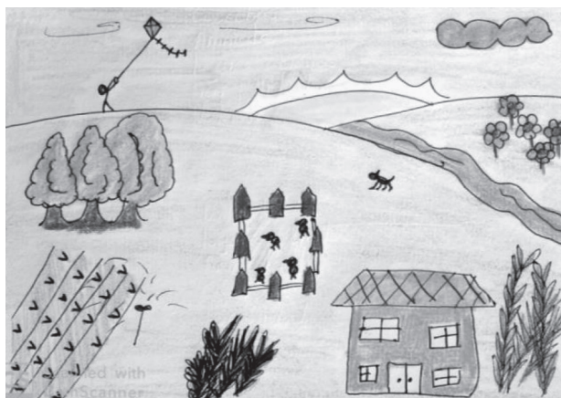
Figura 3. Representación del paisaje rural con complementos agrarios o agropecuarios

La mayoría de estas representaciones pictóricas guarda una estrecha equivalencia con la categoría de paisaje rural de otros estudios 54 , puesto que, aunque no son frecuentes las personas que cultivan y construyen esos paisajes, se intuye la presencia humana en el desarrollo de la actividad económica. La diferencia estriba en el carácter más agrario o agropecuario que rural de esas representaciones, en las que no se ha registrado la actividad industrial o turística, propia de los territorios rurales en cualquiera de los tres países donde hemos seleccionado la muestra de estudiantes (Figura 3). En este caso concreto, la alumna ha expresado que su dibujo representa “una casa de hacienda, con un lugar para los animales, una plantación y un granjero”.