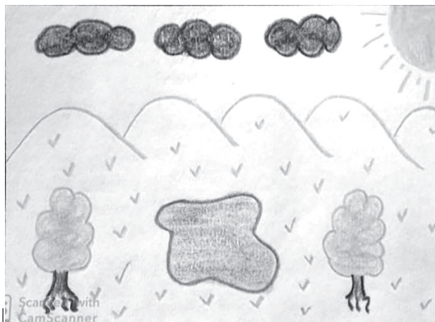
Figura 1. Representación escolar del espacio rural como paisaje natural