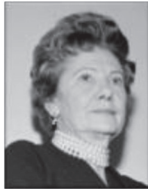
Imagen 3. Ofelia Uribe de Acosta

En el mismo año el Congreso aprobó la Ley 28, cuya vigencia inició a partir de 1º de enero de 1933 sobre reformas civiles en cuanto al «Régimen Patrimonial en el Matrimonio», permitiendo a las mujeres cierta autonomía financiera y la vinculación a actividades económicas, no obstante, su persona aún le pertenecía a los esposos 14 .