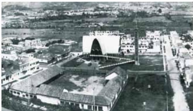
Imagen 1. Construcción escolar en 1940.

Adicional a lo anterior, cada escuela debía de aparecer como la extensión de la Iglesia católica. Y, efectivamente, las escuelas en Antioquia habían sido creadas bajo el amparo y administración de las iglesias católicas; no en vano muchas de las escuelas que hoy existen en Antioquia están ubicadas inmediatamente al lado, en la misma construcción física, o en el contexto cercano a una iglesia católica.