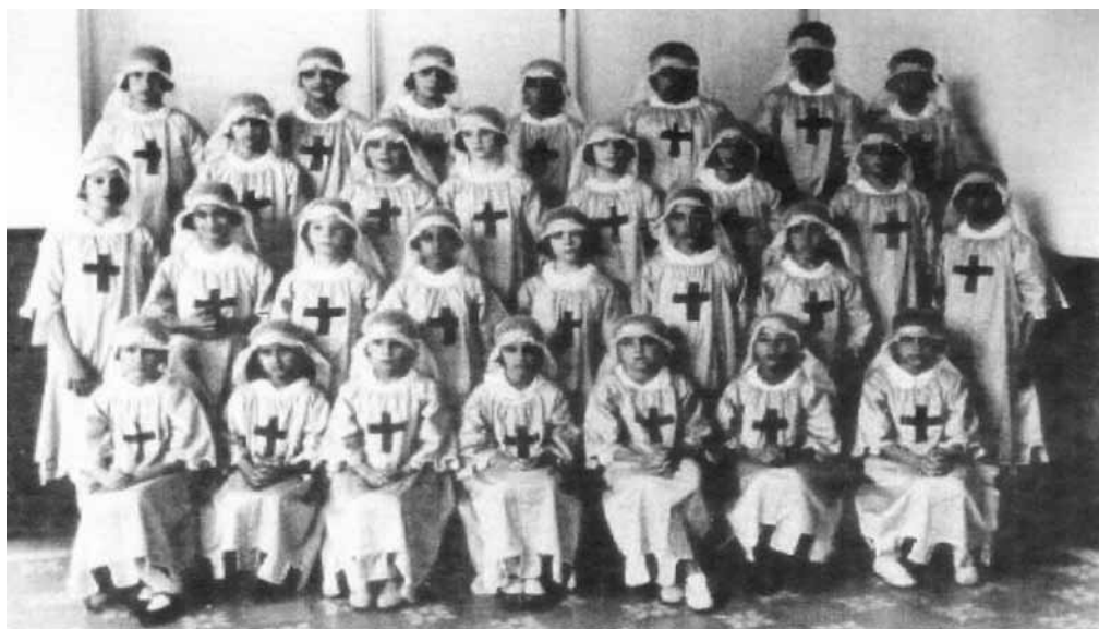
Imagen 2. Colegio de La Presentación, década de los 40.

Era claro, pues, que la llave iglesia católica-poder político estaba seriamente cimentada y que en esta nación, constituida en nombre de Dios y consagrada al Sagrado Corazón de Jesús, no parecía comprensible ni aceptable otro tipo de propuestas sociales. En este orden de ideas, se entiende de qué manera la “viña del Señor” estaba en peligro por la nueva invasión propiciada por la reforma instruccionalista. Esas malas ideas, a que hacían alusión los círculos reaccionarios, eran aquellas que hacían referencia a la obligación de los Gobiernos departamentales de difundir y reglamentar en todo su territorio la Instrucción Primaria, de modo que rápidamente y de manera esencialmente práctica se enseñaran las nociones elementales para el ejercicio de la ciudadanía, la agricultura, la industria fabril y el comercio 29 .