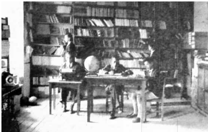
Biblioteca de la Escuela Normal de Occidente.