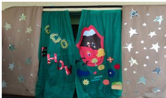
Figura 5. Cenário da Eco Show.

Na ação do Eco Show, evento realizado por ocasião do Projeto didático em comemoração ao dia do meio ambiente, os alunos se inscreveram e apresentaram seu talento: leitura de poesia, de trecho de um livro, dança, música... puderam expressar artisticamente de diversas maneiras, a temática trabalhada. A Figura 5, a seguir, evidencia o cenário da atividade.