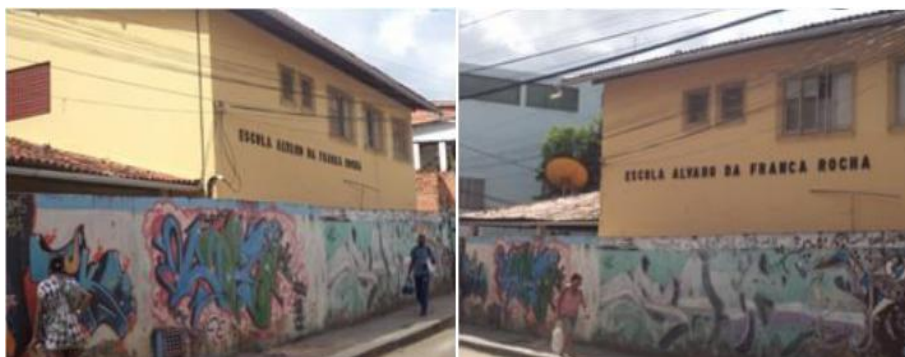
Figura 1. Escola Municipal Álvaro da Franca Rocha.