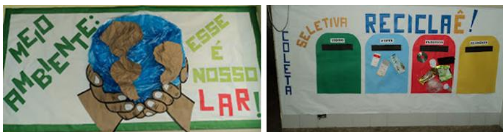
Figura 2. Identidade visual e painel de chamada do Projeto Didático.

Uma das primeiras ações articulada pelas docentes, foi imprimir uma identidade visual ao projeto, a partir de um desenho criado por uma das crianças, na aula de Artes. A Figura 2, apresenta o painel de chamada do Projeto Didático, exposto no pátio da Escola para que toda a comunidade escolar tivesse acesso e conhecimento: