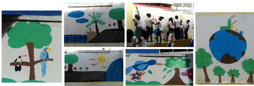
Figura 4. Pintura do muro. Mosaico.

manutenção do espaço: regar, limpar, podar, trazer mudas, entre outros. Na oportunidade foram trabalhadas questões medicinais, tipos de plantas com utilidade para os seres vivos etc. Com ajuda da professora de Artes da escola, outra ação foi realizada: a Pintura do Muro Interno da Escola, pelos alunos, com temática ligada à questão ambiental. Os alunos fizeram esboço dos desenhos em folha de ofício, que foram escolhidos por votação em sala. Sob a orientação da professora de Artes e da Regente da turma, as crianças procederam à pintura do muro. A seguir, estão evidenciados na Figura 4, algumas produções das turmas: