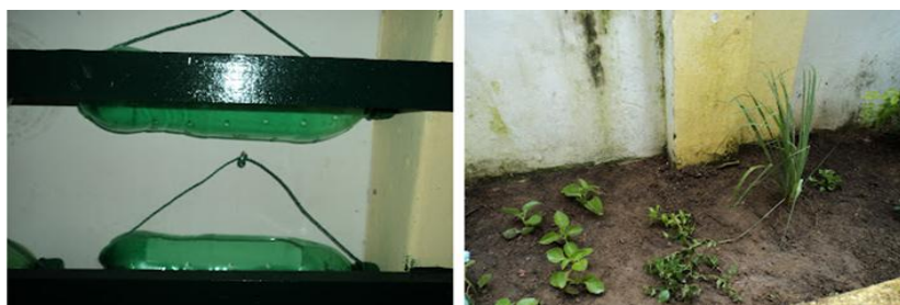
Figura 3. Horta/Jardim escolar.

Com o auxílio de um voluntário, professor da Rede Municipal de ensino de outra unidade escolar, foi organizado uma Horta/Jardim Escolar, num espaço ocioso, existente na unidade (Figura 3).