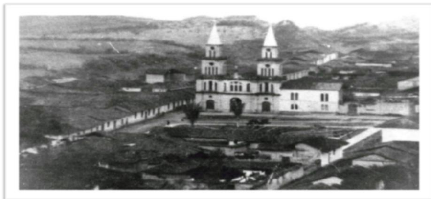
Figura 2. Terminación construcción templo La Cruz.