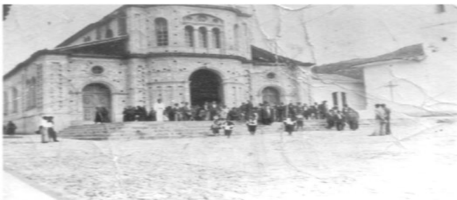
Figura 1. Construcción templo La Cruz