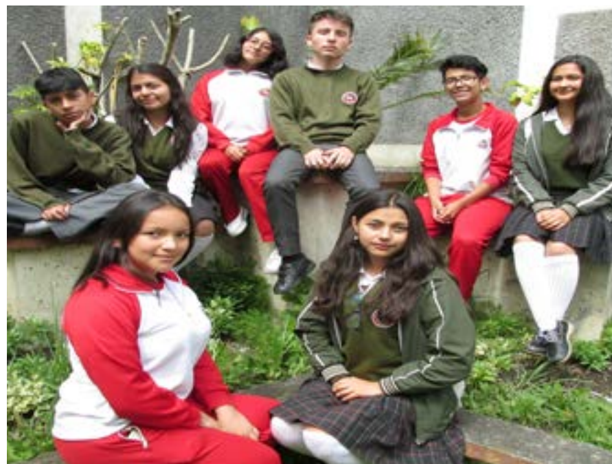
Figura 3: Institución Educativa Liceo de la Universidad de Nariño, primer semestre 2019.

3. Imagen de estudiantes, Institución Educativa Liceo de la Universidad de Nariño