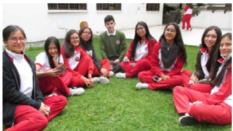
Figura 2: Institución Educativa Liceo de la Universidad de Nariño, primer semestre 2019.

2. Imagen de estudiantes, Institución Educativa Liceo de la Universidad de Nariño