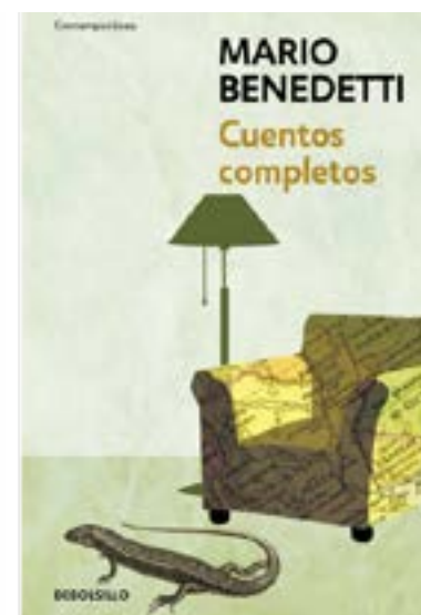
Figuras.3. fuente la presente investigación.

6. Imágenes de portadas de libros referenciadas por el sujeto de estudio.