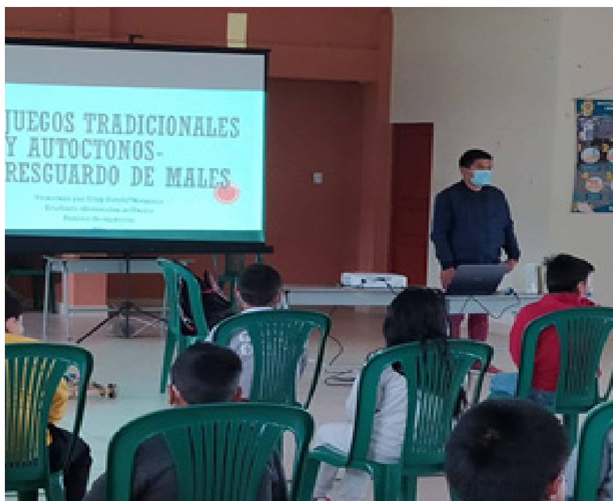
Figura 1: Actividad recordar es vivir

Institución Educativa san Bartolomé pertenecientes al Resguardo Indígena de Males con el fin de dar a conocer los juegos autóctonos y tradicionales, para afianzar la cultura y sana recreación, que se alcanza con ayuda de actividades pedagógicas que se pretende ejecutar mediante un cronograma con tiempos establecidos, siendo este proyecto avalado por el cabildo mayor y llevarse a cabo dentro del resguardo.