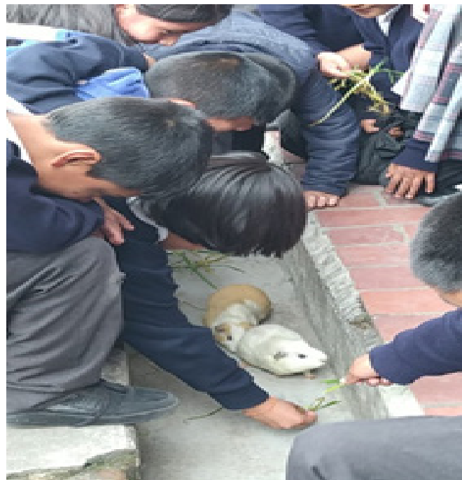
Figura 2: carreras de cuyes

lo particular para llegar a lo general, proporcionando así una visión amplia en cuanto a la población y las herramientas adecuadas para el estudio. Hernández Sampieri et al., (2010), sugiere: “Métodos[técnicas e instrumentos] de recolección de datos no estandarizados ni completamente predeterminados (...), la recolección de datos consiste en obtener las perspectivas y puntos de vista de los participantes (sus emociones, prioridades, experiencias, significados y otros aspectos subjetivos)” En síntesis, “El proceso de indagación es más flexible” (Pág.9).