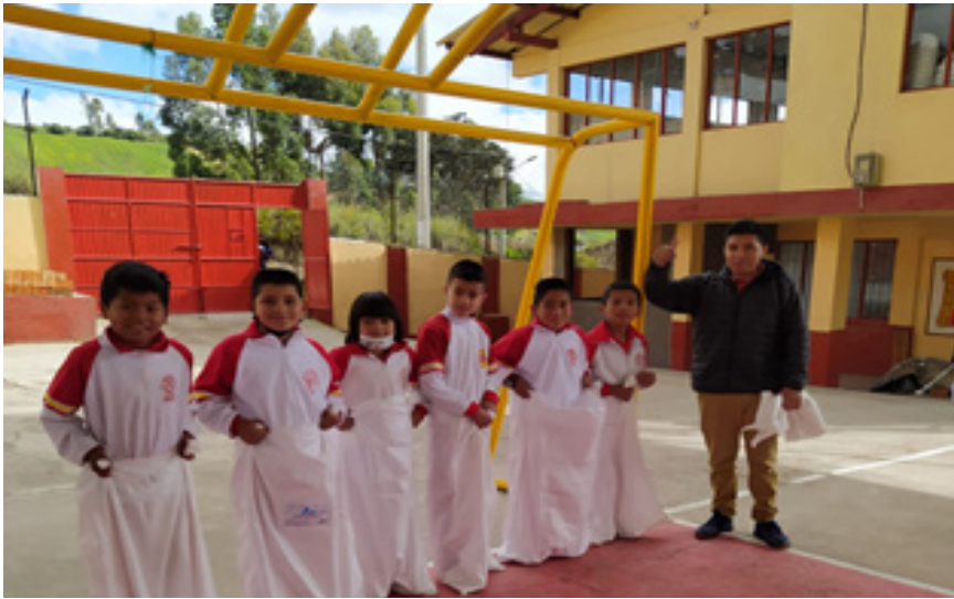
Figura 3: Juego encostalados

Finalmente, se termina con charlas, con los docentes, en donde ellos también se vuelvan a sentir niños jugando con sus estudiantes y contándoles sus anécdotas, y explicándoles cuáles juegos pueden utilizar en sus clases. Así mismo, se recalca el objetivo a cumplir con respecto a la recuperación de los juegos tradicionales y el no perder las costumbres, el sano esparcimiento y finalmente el uso adecuado de su tiempo libre.