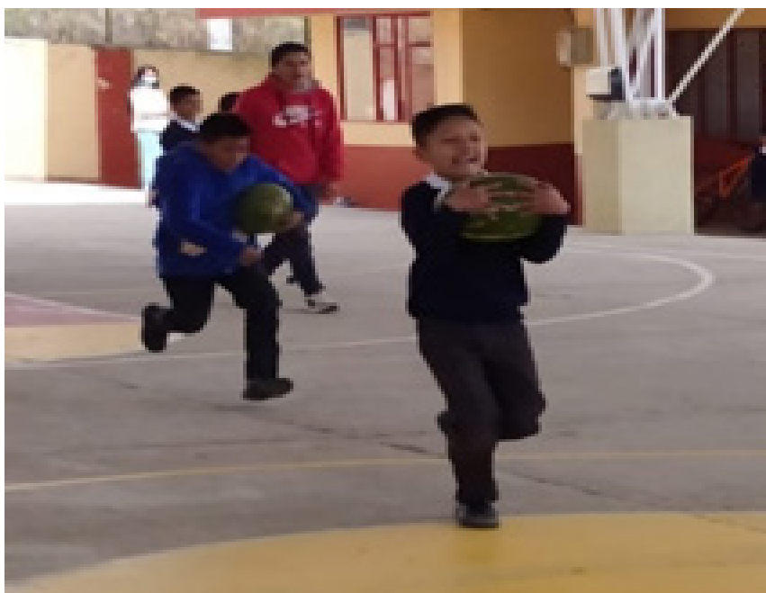
Figura 4: Juego del zambo

Se agradece a todas las personas que hacen parte del proyecto tanto a los gobernadores del resguardo que participaron, como también al cabildo universitario (CIU-Males), por brindar el espacio para poder ejecutar el proyecto, por la gestión ante Fondo de becas Álvaro Ulcué Chocué (icetex), así mismo, un agradecimiento especial a los docentes de la Institución Educativa San Bartolomé (Grado quinto) a todos los niños que se han dispuesto a conocer y aprender en todas las capacitaciones, por su puesto agradecimiento a los adultos mayores, quienes nos compartieron su conocimiento (reglamentos) y anécdotas para recuperar los juegos tradicionales y finalmente a personas que han estado apoyando y siguen de cerca este bonito proyecto.