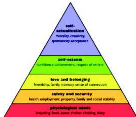
Maslow's Pyramid, tomado de Donald Clark Plan B, http://donaldclarkplanb.blogspot.com.co/2012/04/maslow-

La primera se conoce como Drive Theory o Pulsión, cuya teoría define que la motivación nace de ciertas pulsiones o accionamientos. David Ausubel (1968) citado por Brown (1994) explica la