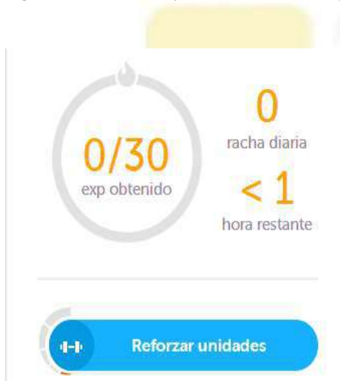
Figura 2: Unidades aprendidas

Las figuras anteriores, son el ejemplo de las lecciones y las unidades aprendidas o por reforzar.