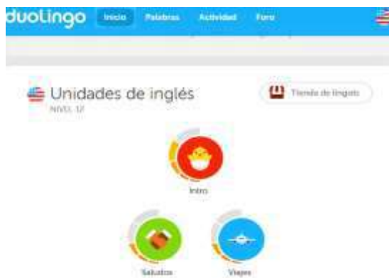
Figura 1: Lecciones y niveles de Duolingo