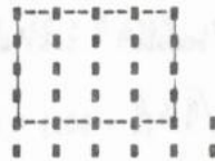
Ilustración para N = 32 :