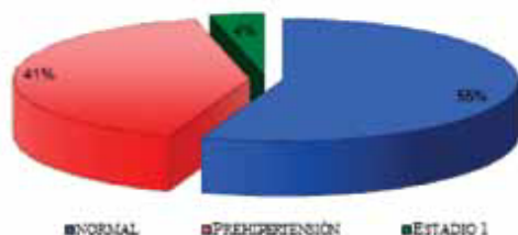
Gráfico 1. Presión arterial y sedentarismo de los jóvenes universitarios entre 18 y 23 años de edad en la ciudad de Pasto 2010 (n=216)

Del total de participantes, 125 confirmaron haber fumado, no obstante 77 de ellos presentaron problemas reales de adicción al consumo de cigarrillo. Este último grupo y sus trastornos de la tensión arterial. (Gráfico 2).