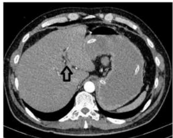
Figura 2. Tomografía axial computarizada de abdomen que evidencia neumobilia en el sitio donde anatómicamente debería estar la vesícula.

La tomografía de abdomen total simple y contrastada reportó “Vesícula biliar no visualizada, en su reemplazo se observan cambios en la densidad del hilio hepático y lecho vesicular, con colecciones de aire. A nivel de la válvula ileocecal reducción importante de calibre, no se observa cuerpo extraño ni masa, tampoco alteraciones de la grasa peri-cecal. Considerar engrosamiento o efecto estenótico parcial a nivel de válvula ileocecal que condiciona obstrucción intestinal (solo intestino delgado). Se observa distensión marcada de todas las asas delgadas desde el duodeno hasta el íleon distal” (figuras 2 y 3).