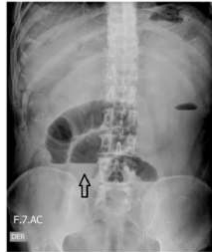
Figura 1. Radiografía simple de abdomen donde se observan niveles hidroaéreos (flecha), indicando obstrucción intestinal

Con impresión diagnóstica de obstrucción intestinal se inició manejo con líquidos endovenosos, protección gástrica, analgésicos, antiespasmódico y antiemético. Se realizó paso de sonda nasogástrica y se obtuvo abundante material fecaloide. La serie radiológica de abdomen evidenció niveles hidroaéreos y ausencia de gas distal (figura 1).